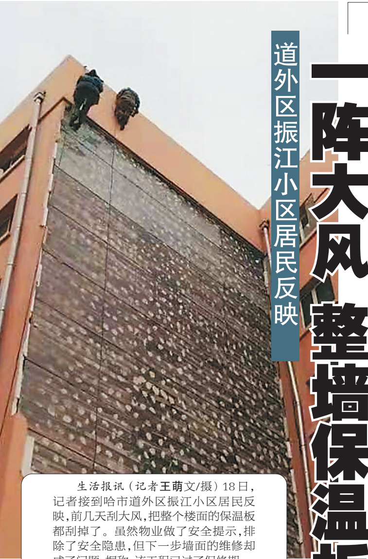
生活报讯（记者王萌文/摄）18日，记者接到哈市道外区振江小区居民反映，前几天刮大风，把整个楼面的保温板都刮掉了。虽然物业做了安全提示，排除了安全隐患，但下一步墙面的维修却成了问题，据称，该工程已过了保修期。