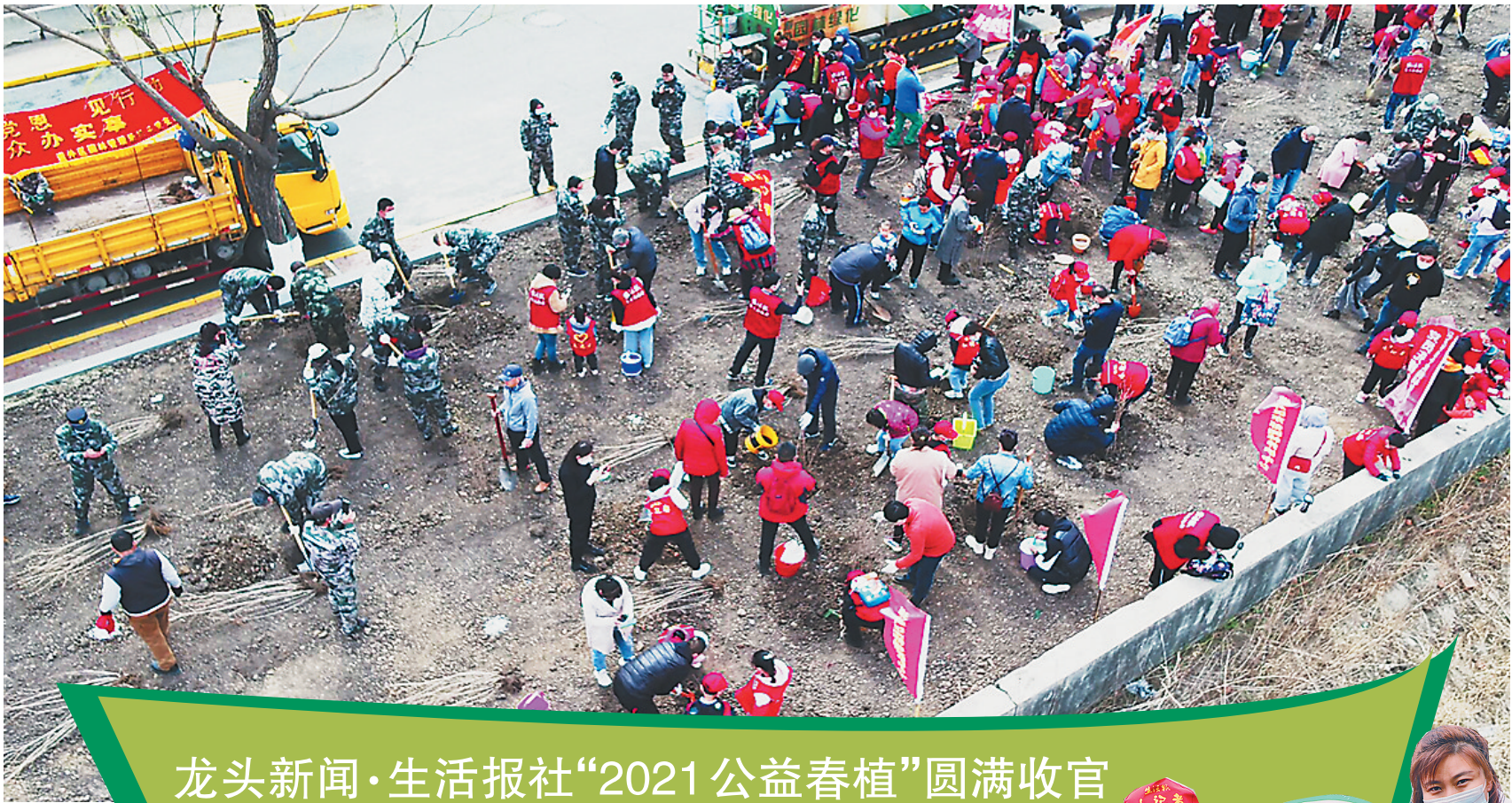
龙头新闻·生活报社“2021 公益春植”圆满收官