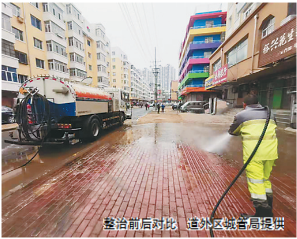
整治前后对比

区全部备案经营市场均已施行规范化经营管理，集中清理整治工作取得了可喜的成果。在过去的近一个月的时间里，道外区城管局在各相关部门的大力支持下，通过不断加大工作力度，层层分解目标责任，相继规范整治了北棵二道街、太安街、北七道街、大水晶街摊区市场的各种乱相，裁撤了南十六道街自发形成的占道经营市场，为全区的市场摊区管理工作打下了良好的基础，市场摊区管理水平、周边环境秩序明显提升。