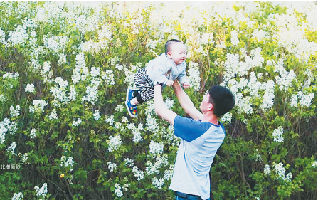
资料片 张澍 摄

生活报讯（记者赵政府）生活报19日刊发了《昔日满城丁香 如今难觅芬芳》的报道，引起社会广泛关注。连日来，生活报接到很多市民、网友的留言、来信，除了回忆哈尔滨满城丁香的盛况外，还有“出谋划策”的。在这些留言来信中，曾任黑龙江省建筑设计研究院副总建筑师的李长敏，从专业角度分析了哈尔滨市丁香减少的原因，还给他的家乡哈尔滨市“丁香城”建设提出了一些自己的建议。