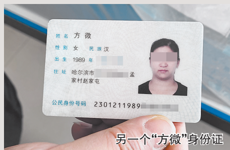
另一个“方微”身份证