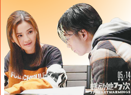
生活报记者 王雪莹