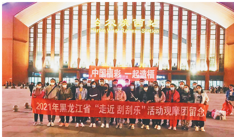
一张小小的福利彩票,凝聚着大家对社会公益事业和社会福利事业奉献的一片初心。相信在观摩活动中,大家一定会在见证福利彩票阳光透

届时观看直播的彩民朋友们,可以通过中彩网、“黑龙江福彩”官方抖音账号、“钉钉”APP、销售站网络视频一体机观看全程直播,还可以参与无门槛抢红包活动。同时关注“黑龙江福彩”微信公众号,回答问题口令,还有机会赢取精美黄金饰品、福彩即开票等盲盒大礼。