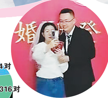
龙头新闻记者 赵博/制图