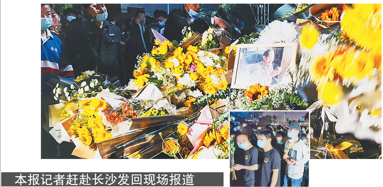
本报记者赶赴长沙发回现场报道

据新华社长沙5月22日电 记者从中南大学湘雅医院等渠道获悉,5月22日13时07分,“杂交水稻之父”、“共和国勋章”获得者、中国工程院院士袁隆平因病医治无效,在长沙去世,享年91岁。 袁隆平出生于1930年,从事杂交水稻研究50多个春秋。他是我国研究与发展杂交水稻的开创者,也是世界上第一个成功利用水稻杂交优势的科学家,是享誉世界的“杂交水稻之父”。 近二十年,他带领团队开展超级杂交稻攻关,不断刷新产量纪录。直 到今年年初,袁隆平院士还坚持在海南三亚南繁基地开展科研。 “禾下乘凉梦”是袁隆平一生的梦想,“发展杂交水稻,造福世界人民”是他的孜孜追求。近年来,杂交水稻在国内的年种植面积超过2.4亿亩,每年在海外的种植面积达800万公顷。