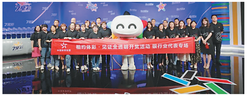
团在摇奖机前集体拍照留念,结束了本次见证体彩开奖之旅,同时也为“相约体彩·见证全透明开奖”活动画上圆满的句号。