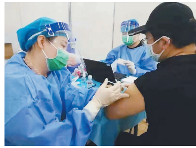
生活报讯(记者周琳)26日,记者从哈尔滨市疾病预防控制中心获悉,自

2020年10月下旬启动新冠病毒疫苗接种工作以来,哈尔滨市有力、有序推进了接种工作进度,截至5月25日24时,哈尔滨市累计接种新冠病毒疫苗突破700万剂次,完成接种5506829人,其中,完成二剂接种1569434人。