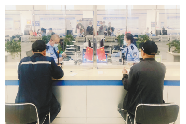
务;便利出国(境)人员延期换证等举措。

生活报讯(记者何兴丽)近日,公安部推出的公安交管12项便利措施引起了社会广泛关注,并于6月1日起正式实施。 哈市交警部门介绍,驾管业务方面便利措施包括对申请小型自动挡汽车、残疾人专用小型自动挡载客汽车驾驶证的,科目二考试取消“坡道定点停车和起步”项目;60周岁以上老年人可使用亲友的“交管12123”APP账号,由亲友代办网上驾驶证业