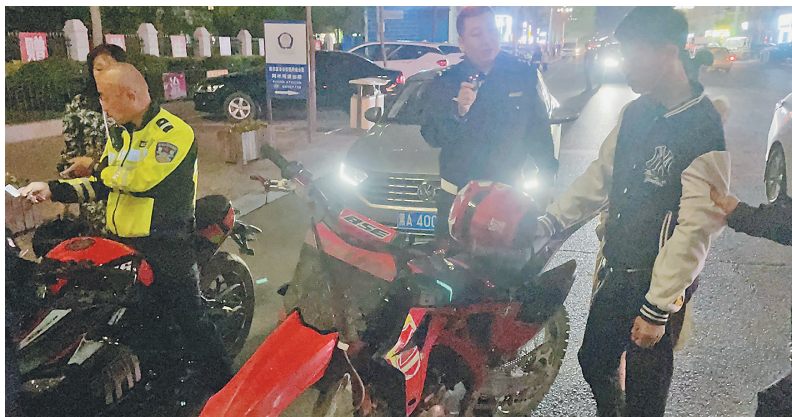
驾驶人无证 摩托车无牌

进近系统、北端设置I类精密进近系统;新建90个机位的站坪、2万平方米的货运站、5.56万平方米的辅助生产生活用房;配套建设助航灯光、消防救援、供电供水等设施。可研批复项目总投资91.92亿元,用地约560公顷,建设周期为4年,由黑龙江机场集团组织实施。