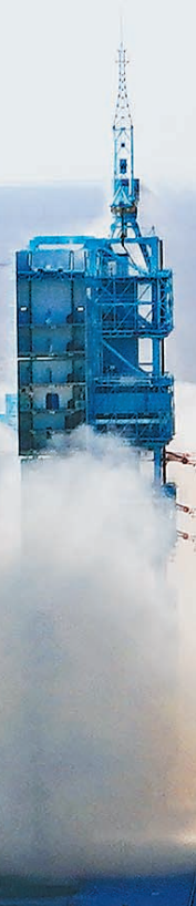
自立 自强 创

这是我国载人航天工程立项实施以来的第19次飞行任务,也是空间站阶段的首次载人飞行任务。飞船入轨后,将按照预定程序,与天和核心舱进行自主快速交会对接。组合体飞行期间,航天员将进驻天和核心舱,完成为期3个月的在轨驻留,开展机械臂操作、出舱活动等工作,验证航天员长期在轨驻留、再生生保等一系列关键技术。