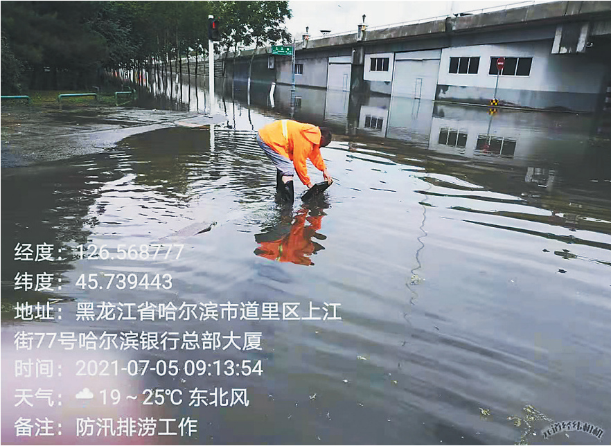
经度: 126.568777 纬度: 45.739443 地址: 黑龙江省哈尔滨市道里区上江街77号哈尔滨银行总部大厦 时间: 2021-07-05 09:13:54 天气: 19~25°C 东北风 备注: 防汛排涝工作

截至记者发稿前,科研路已能通车,积水深度10-20厘米,面积400平方米,如果6日不下雨,预计下午能够全部排除积水。