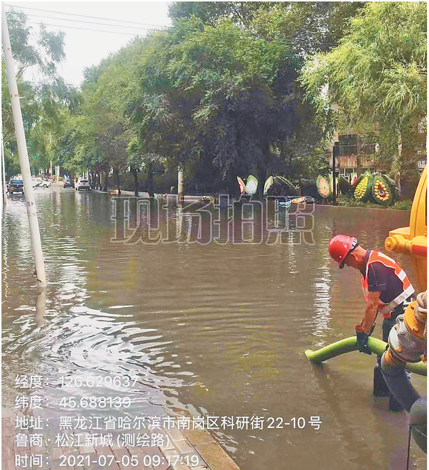
经度: 126.620637 纬度: 45.688139 地址: 黑龙江省哈尔滨市南岗区科研街22-10号 鲁商·松江新城(测绘路) 时间: 2021-07-05 09:17:19