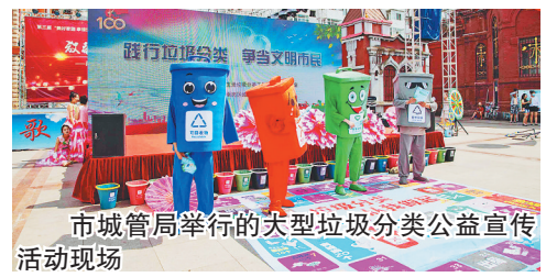
市城管局举行的大型垃圾分类公益宣传活动现场

据悉,哈尔滨市将于7月初在9个城区陆续组织开展54场(次)“践行垃圾分类,争做文明市民”主题宣传活动。