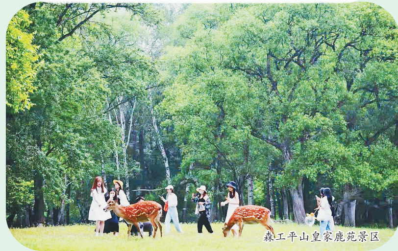
森工平山皇家鹿苑景区

生活报讯(记者 吴海鸥 薛宏莉)持续的高温天气,挡不住冰城人爱玩的心。记者从哈市各大景区获悉,近段时间,“森呼吸”亲水、找阴凉热度不减,欢乐游园赶夜场以及室内游园备受青睐。