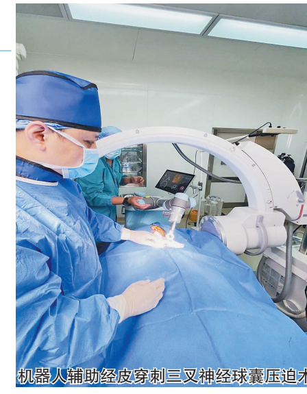
机器人辅助经颅穿刺三叉神经球囊压迫术

目前睿米神经外科手术机器人已成功应用于脑出血钻孔引流术、脑脓肿钻孔引流术,深部脑肿瘤活检术,三叉神经痛球囊压迫术,帕金森、癫痫等疾病的治疗当中,并取得良好效果。