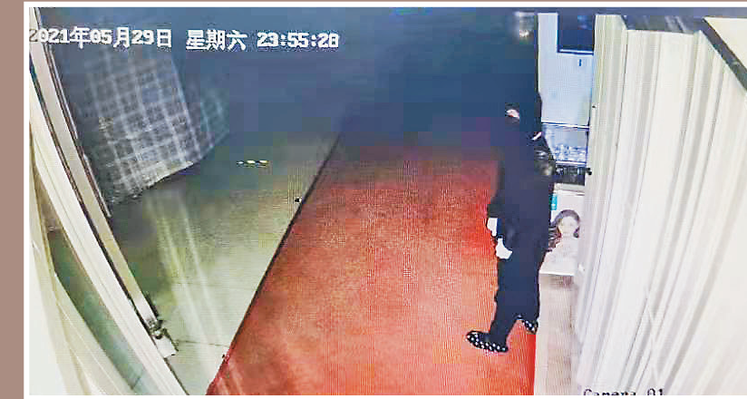
2021年05月29日 星期六 23:55:28