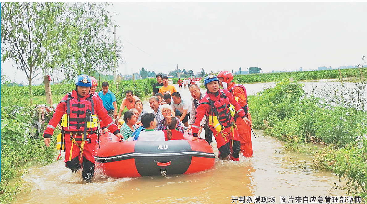
开封救援现场

综合新华社、央视网等报道 河南省郑州市防汛抗旱指挥部22日发布消息:根据目前汛情发展情况,经郑州市政府领导同意,各区县(市)防汛根据当地汛情,适时调整防汛应急响应级别,各地各有关部门要突出做好当前抢险救援、灾后处置等各项工作。