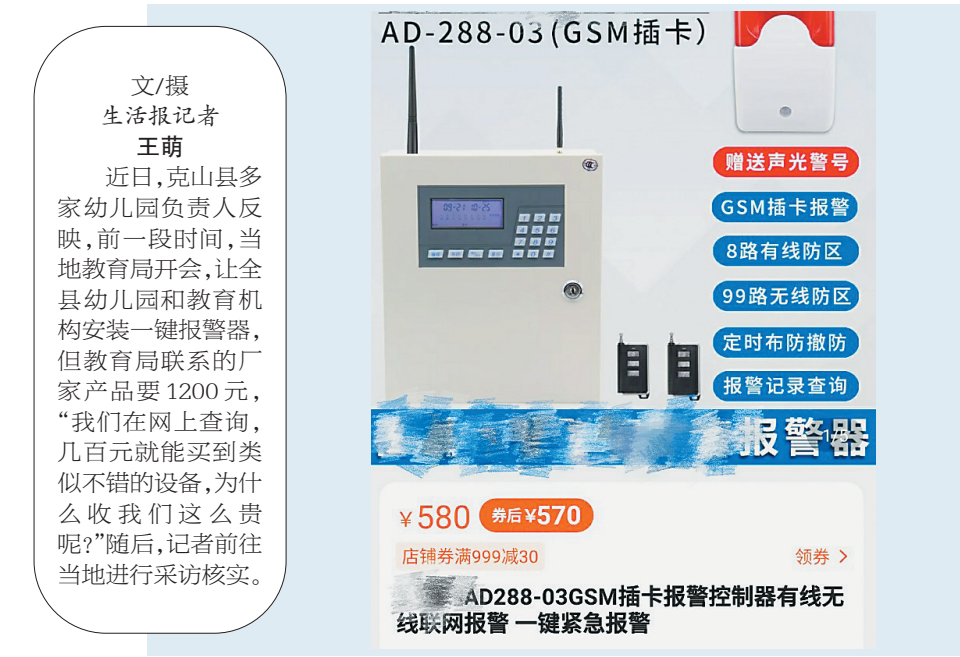
网上销售页面截图