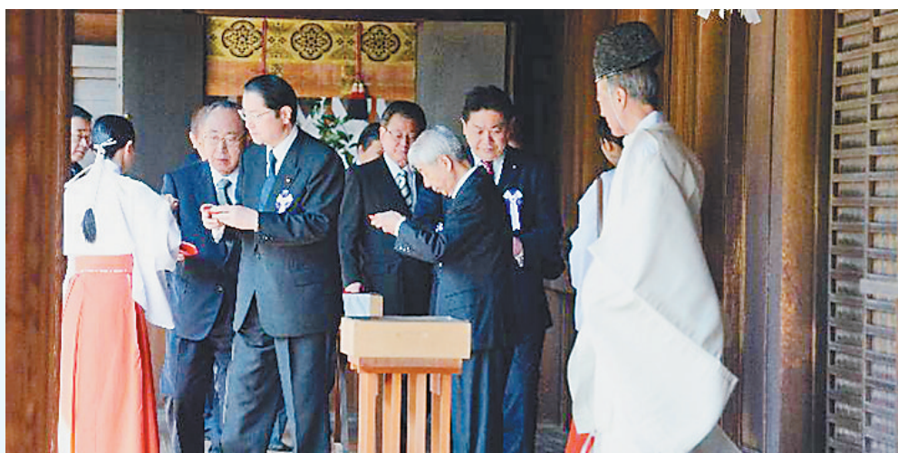
图为2016年4月22日拍摄的日本跨党派国会议员团体“大家都来参拜靖国神社国会议员之会”成员参拜靖国神社的资料照片。

中韩等遭受过日本侵略的亚洲国家已多次对日本政客参拜靖国神社表达不满和抗议。中国国防部13日就岸信夫参拜靖国神社表示，此事再次反映出日方对待侵略历史的错误态度和挑挑战战后国际秩序的险恶用心，中方要求日方认真反省侵略历史，时刻牢记历史教训，采取措施纠正错误，以实际行动取信于亚洲邻国和国际社会。