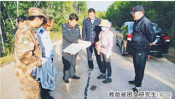
救助被困女研究生(右二)

警方提示，人员上山时，一定不要只顾低头采集，要时不时地抬头观察四周环境，并与同伴呼喊通联，一旦迷路应尝试挪动位置向外界拨打电话求助，选择一个安全、辨识度高的地点等待救援，切不可盲目乱跑耗尽体力。生活报记者 时继凯 整理