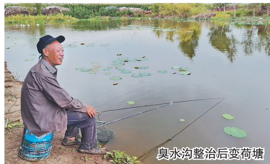
臭水沟整治后变荷塘