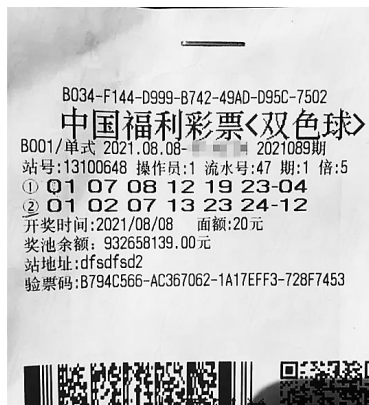
据福彩双色球微信公众号

手换了两次，直到第三组号码出现，销售员问：“这两注可以吗？”他对第三次机选出的号码表示满意，直接向销售员提出打5倍！ 9日早上，他拿起手机查看双色球开奖结果，“第二注红球、蓝球全中了，一等奖奖金533万，5注就是2600多万！当时我连税后奖金都算好了，扣除20%的税后能拿到2135万。至于奖金的用途，我早就想好了，投资拓展生意规模！” 对福利彩票的公益属性，大奖得主给予了高度评价：“我知道福利彩票是公益事业，国家发行它就是为了帮助那些生活困难的群体。其实这些年来我也在尽自己的所能去帮助贫困孩子。每年寒暑假，我和