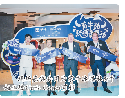
现场嘉宾共同为蒙牛冰淇淋&牛奶工坊Cutie Cones剪彩

北京环球城市大道是一个集零售、餐饮、娱乐为一体的娱乐中心，位于北京环球度假区的主入口，连接北京环球影城主题公园，身处北京环球城市大道，游客还可以在冰淇淋、乳品售卖推车等多处享用到蒙牛的创意产品，体验到口味多样、层层惊喜的趣味享受。