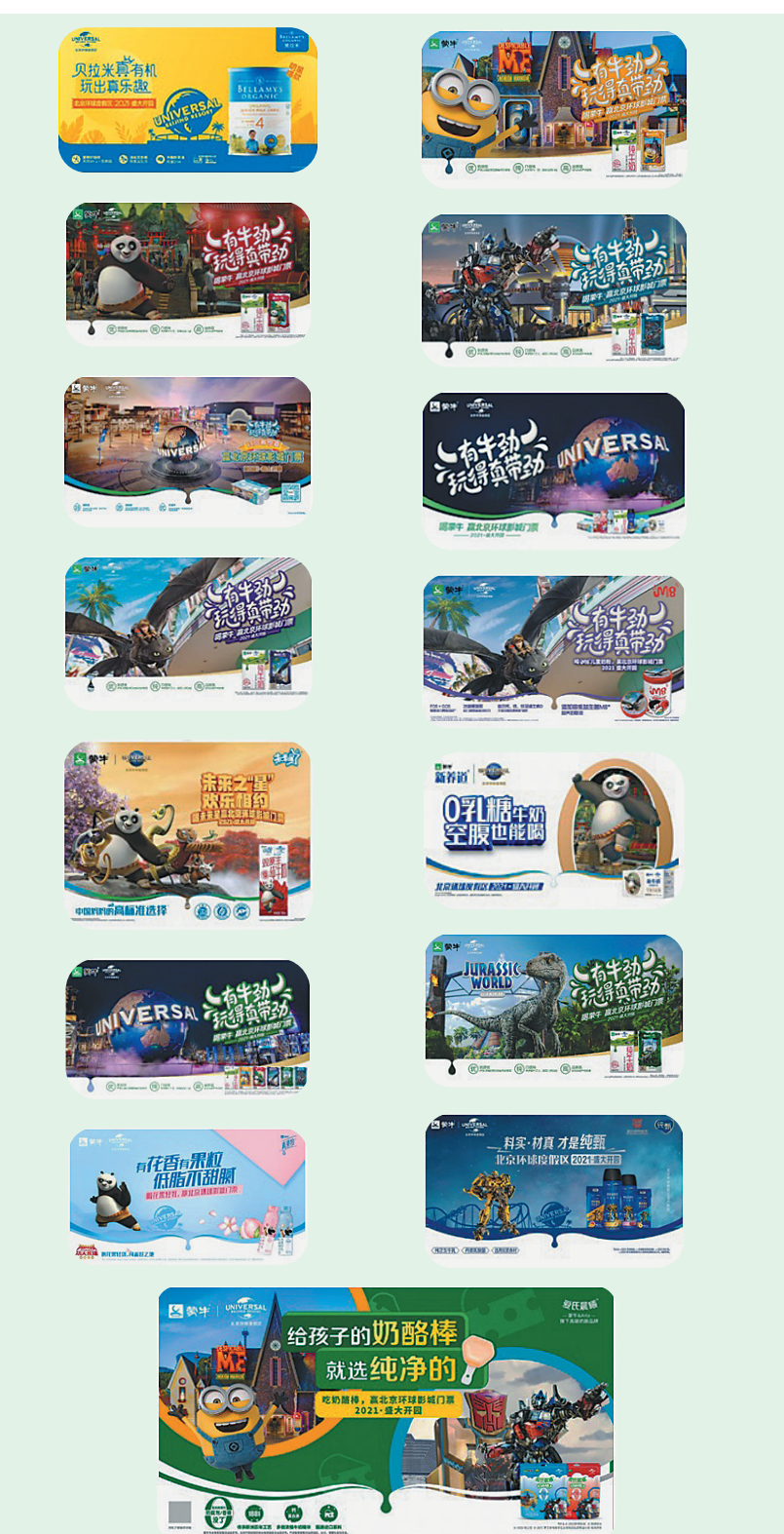
蒙牛此次推出的20余款北京环球度假区定制包装部分展示

孜孜不倦、匠心制造，对品质的不懈苛求，成为蒙牛与北京环球度假区达成战略合作伙伴关系的基础。多年来，蒙牛以品质建设为引领，不断加大创新力度，生产出更多高品质产品。在奶源建设领域，蒙牛致力于解决上游“卡脖子”的瓶颈问题，不断推动奶源高水平发展；在消费者层面，蒙牛围绕“消费者第一第一”的核心价值观，向消费者提倡营养健康的生活方式；在数字化领域，蒙牛聚焦全产业链数字升级，实现了“从牧草到奶杯”的全程品质提升。