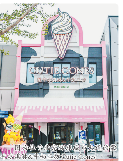
图为位于北京环球城市大道的蒙牛冰淇淋&牛奶工坊Cutie Cones