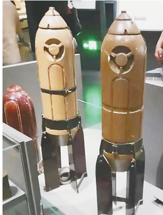
资料来自侵华日军第七三一部队罪证陈列馆网站