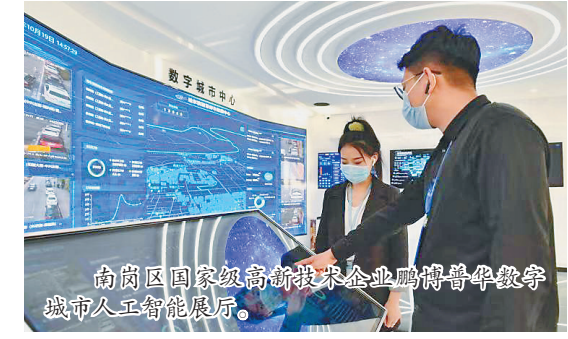
南岗区国家级高新技术企业鹏博普华教学城市人工智能展厅。

获批成为国家级双创示范基地后，南岗区通过整合创新创业资源与要素，再通过服务落地，最终实现助力产业互联的目标，让创新创业更加简便高效。2021年积极组织推荐区域内黑大生物质新材料科技有限公司生物质石墨烯应用、哈工大人工智能有限公司可带电绝缘涂覆机器人等34个创新创业优质项目申报“2021年全国大众创业万众创新活动周”参展项目。 “目前，南岗区域内普通本科高校创新创业载体建设已实现全覆盖。”南岗区工科局孵化器工作负责人说，近年来，南岗区正重点布局建设哈尔滨工业大学、哈尔滨工程大学、哈尔滨理工大学3个大学经济圈。根据不同大学学科优势，分期分批规划建设升级改造创业苗圃—孵化器—加速器—产业园区，推动中关村基地孵化器、哈尔滨创业孵化产业园等众多载体陆续建成，大学周边“10分钟创业生态圈”基本形成。 在“双创”平台的带动下，南岗区已孕育、孵化了一批创新企业，生成、落地一批高成长性的产业项目，切实把“创新之泉”源源不断注入“产业之田”。2021年上半年，南岗区共有141家企业获得省市高企奖补、研发投入后补助资金累计3009万元；在黑龙省公示五批次入库国家科技型中小企业评价系统备案名单中，南岗区企业有447家，占全市的24%；2020年南岗区技术合同成交额达75.89亿元，约占全省的30%。