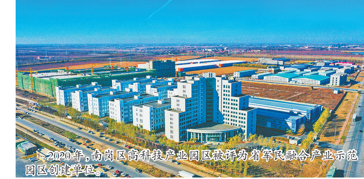
2020年，南岗区高科技产业园区被评为省军民融合产业示范园区创建单位。

南岗区高科技产业园区位于哈尔滨市松花路与哈南第十二大道交汇处，紧邻京哈高速公路，北起江南中环路，南至运粮河，西起哈双公路，东至松花路，总规划面积38.2平方公里，起步区2平方公里，是黑龙江省唯一一家新材料产业基地。园区重点发展新能源、新材料等战略性新兴产业，累计投资5.8亿元，建设创业孵化大厦和标准化厂房9.4万平方米，先后引进哈工大研究成果烯创新材料、哈理工研究成果哈普电气、防疫物资生产企业银嘉医疗器械、黑龙江省石化院特种胶黏剂等优秀项目落地，推动产业发展由资源驱动向创新驱动转变。2020年，园区被评为省军民融合产业示范园区。