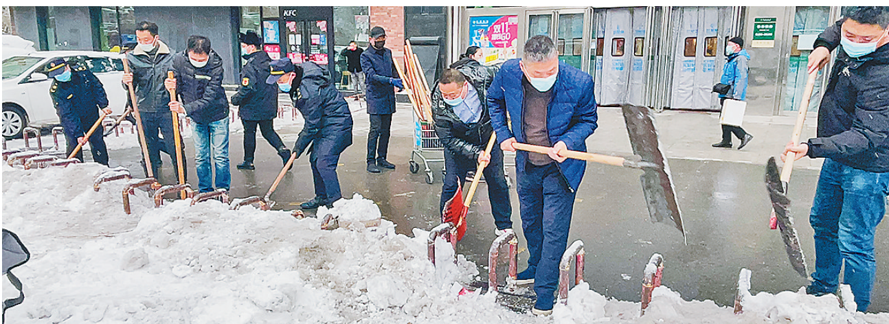
哈尔滨市累计出动人员11.7万人次 清运积雪2.36万车次

从目前受害严重的树木来看，专家认为，能够承受这种极端气候的绿化材料应多从乡土树种中筛选，确保多样化的前提下可首选榆树、蒙古栎、椴树、水曲柳、胡桃楸等，更有利于防灾减灾的树种。