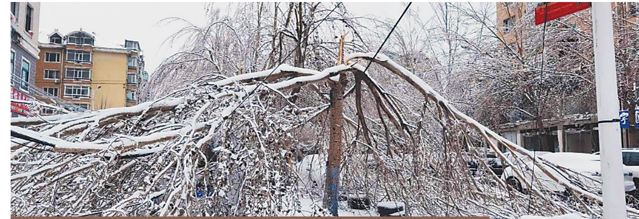
冻雨风雪中，冰城杨树柳树“不堪重负”