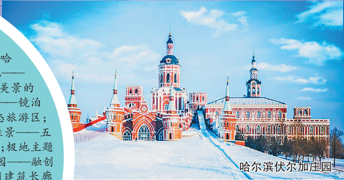
哈尔滨伏尔加庄园

生活报讯（记者吴海 鸥 薛宏莉）冰雪旅游，首选童话龙江。生活报记者从黑龙江省文化和旅游局获悉，今冬，我省重点推介五座冰雪旅游城市，推出了十五个冰雪旅游必到必游地，无一不是冬季冰雪旅游顶流。