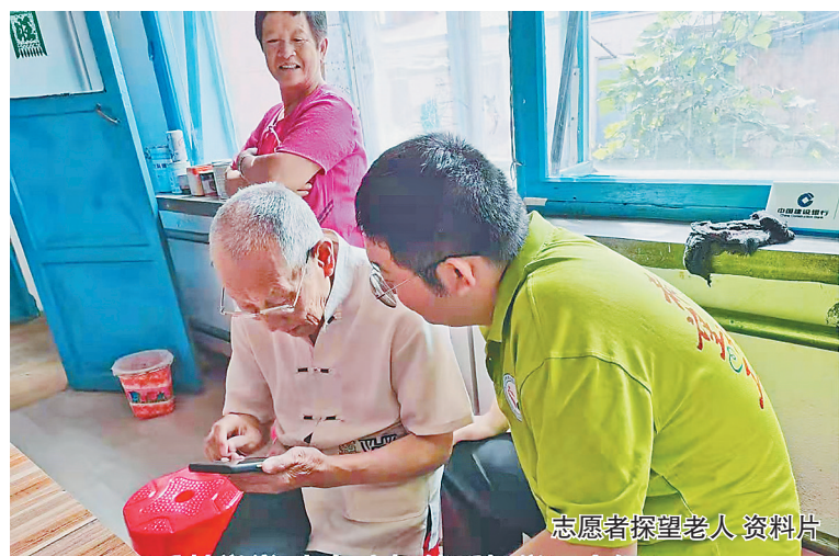
志愿者探望老人 资料片

给予不超过一年的低保渐退期。二是进一步调整基本生活保障水平。适时启动社会救助和保障标准与物价上涨挂钩的联动机制,保障困难群众基本生活水平不因物价上涨而降低。对低保家庭中的重度残疾人、重病患者、老年人、未成年人等6类人群,按照当地低保标准的15%予以低保金加发。三是完善低收入人口动态监测预警机制。四是建立主动发现快速响应机制。五是开展低收入人口常态化救助帮扶。加强社会救助资源统筹,加强部门沟通协调,根据低收入人口对象类型、困难程度等,及时有针对性地给予救助。基本生活存在困难的及时纳入最低生活保障、特困人员救助供养等社会救助兜底保障范围。符合教育、医疗、住房、就业等专项救助条件的,由相关部门依规纳入相应救助范围。