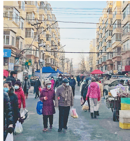
生活报讯（记者于海霞文/摄）“今天是我这一个月以来第一次在外面吃早餐。”