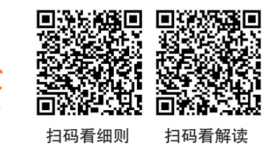
扫码看细则 扫码看解读

誉的，不再享受相关待遇。 4. 申请下一年度生活补贴时，需提交上年度纸质发放凭证、年度考核意见表及劳动合同、基本养老保险缴费信息。 5. 用人单位对纸质发放凭证进行建档备查。 哈尔滨市高技能领军人才（包括市行政区域内全国劳动模范，全国五一劳动奖章、中华技能大奖获得者，全国技术能手、国家级技能大师工作室领办人，享受省级以上政府特殊津贴的技能人才和省、市政府认定的其他“高精尖缺”高技能人才）在哈连续工作满10年以上，在办理退休手续时，按照国家级、省级、市级获奖类别，分别给予一次性10万元、8万元、5万元退休补助。 补助要求： 1. 2021年1月4日以后退休的哈尔滨市高技能领军人才，可享受退休补助。退休时间以《退休审批表》审批