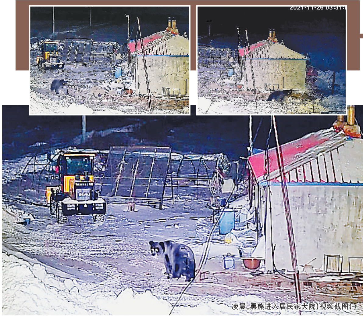
凌晨，黑熊进入居民家大院（视频截图）