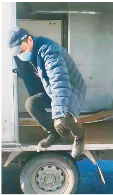
驶人货车违法载人的行为作出 100 元罚款的处罚，藏匿人员交相关部门做进一步处理。

生活报讯（姜文鑫 记者何兴丽）疫情防控期间，市民进出各城市检查点均需按照相关规定提供核酸检测报告，而一名男子竟想出了“妙招”：企图藏在货车车厢内部逃避检查。近日，哈市交警部门在临检过程中就查处了这样一起案件。 12 日 11 时许，一辆小型厢式货车经过东升疫情防控检查点时，交警哈西大队执勤警力依次核对了驾驶员的驾驶证、行驶证、核酸检测报告后，又对封闭式车厢内部进行临检。令民警大吃一惊的是，打开车厢后竟然有一男子藏在其中，民警随即令其下车接受检查。原来，该男子打算自机场路去双城五家镇方向办公，由于没带 48 小时内核酸检测报告，便在侥幸心理的作用下，企图藏在车厢内部逃避查验，没想到还是被交警部门查处。 民警随后向二人介绍了货车违法载人危害以及不配合疫情防控政策的风险，并对其做出严厉的批评教育，驾驶人也深刻认识到了自己的错误，并写下保证书，保证今后再也不会发生此类事件。最终，交警对驾