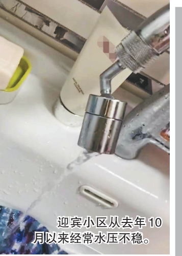
迎宾小区从去年10月以来经常水压不稳。

据哈尔滨供水集团工作人员介绍,目前,哈建投工作人员正在对漏点进行抢修。“之前的老泵房是物业的,是租的,年底到期后物业不续费了,然后就切换成新泵房了。因为有一楼居民不同意施工,所以彻底更换管线需要先做好一楼居民的工作,而且现在是冬天,不允许施工。”有到明年开春才能彻底解决。现在就是哪有漏点,随时补漏。”供水集团工作人员表示。