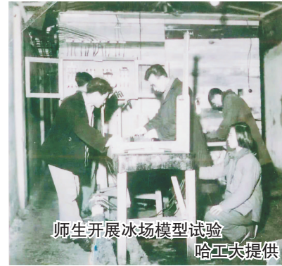
师生开展冰场模型试验

运动中心，不同时期的哈工大人以智慧助力我国冰雪运动发展，以科技助力北京冬奥会和冬残奥会。在北京冬奥会开幕倒计时20天之际，记者带你领略冬奥场馆“蕴含”的哈工大智慧。