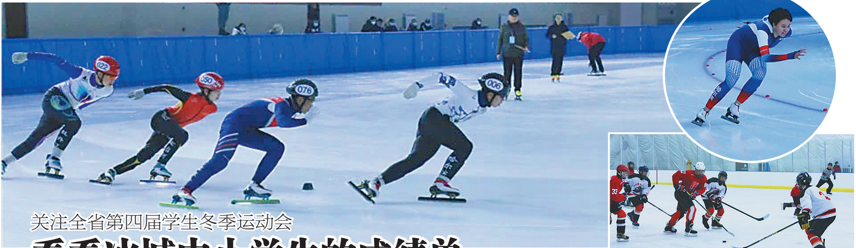
关注全省第四届学生冬季运动会

控指挥部对涉疫情风险地区人员排查管控工作的统一部署，对旅行社途经风险地区参团旅游人员进行排查（视疫情变化动态调整），主动配合所在社区采取相关管控措施。依法妥善处理游客行程调整和退团退费事宜，维护游客与旅游企业的合法权益。要进一步强化大局意识和责任意识，克服松劲心理、麻痹心态，发扬连续作战精神，坚决落实行业疫情防控的各项措施要求，坚决防止疫情通过文化和旅游途径传播。