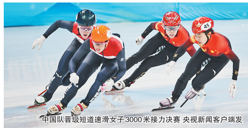
中国队晋级短道速滑女子3000米接力决赛 央视新闻客户端发

犯了不该犯的错误,赛前给了自己压力,导致自己今天表现不是很好,其实不应该想那么多。”