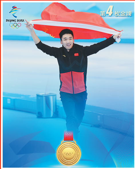
高亭宇 速度滑冰男子500米