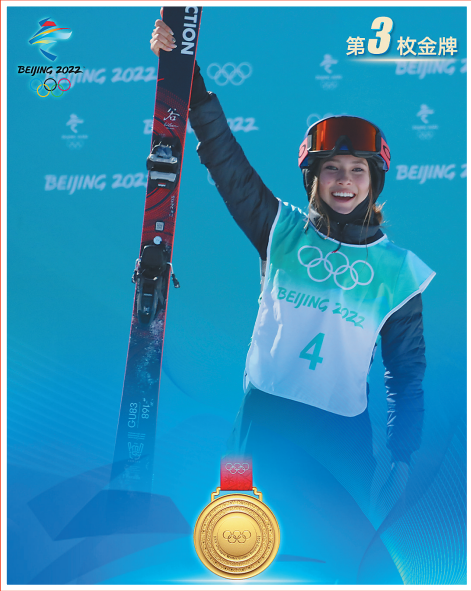
谷爱凌 自由式滑雪女子大跳台