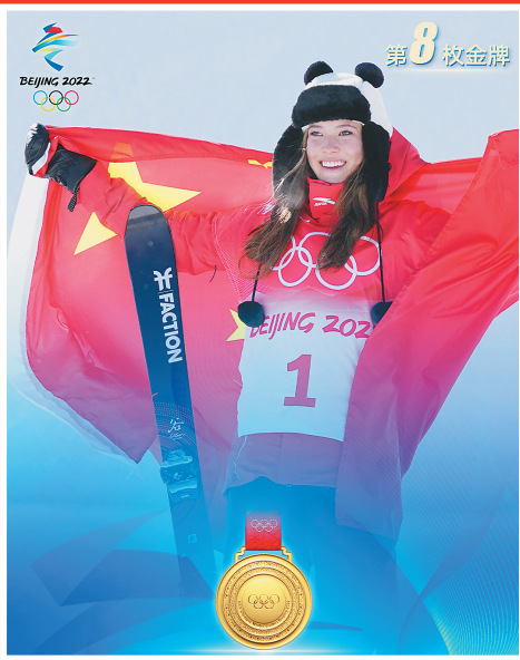
谷爱凌 自由式滑雪女子U型场地技巧