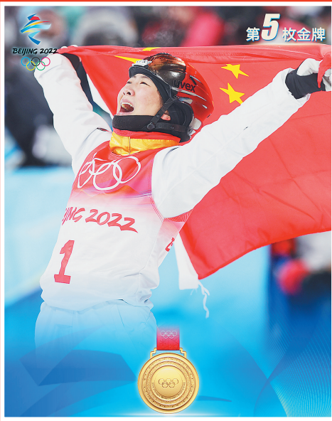
徐梦桃 自由式滑雪女子空中技巧