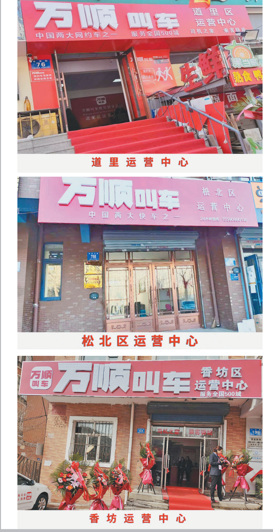
道里运营中心 松北区运营中心 香坊运营中心

生活报讯(记者 栾德谦)当下,网约车逐渐成为人们出行的日常,在给年轻人带来更多便利的同时,一些不太会使用这些新功能的老年人却“裹足不前”。