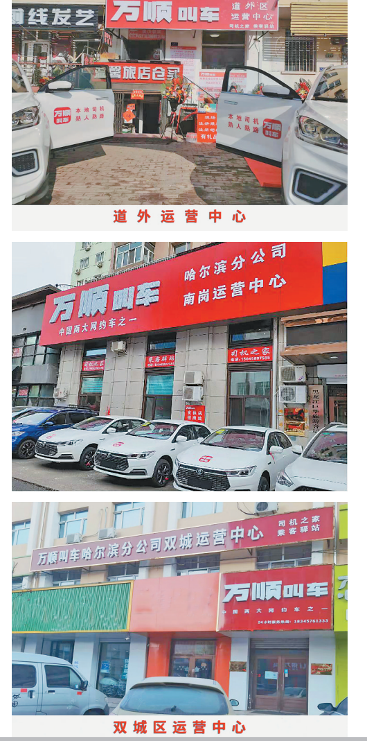
道外运营中心 南岗运营中心 双城区运营中心

“一键叫车”按钮就能呼叫万顺叫车。 目前,万顺叫车在哈尔滨已经建立67家线下实体店,其中南岗区14家、道里区5家、香坊区16家、道外区13家、平房区4家、松北区5家、呼兰区1家、双城区7家、五常市1家。实体店不仅方便周边居民(特别是老人和小孩)的出行,同时为环卫工人提供休息取暖热水等便利条件等。 今年2月,万顺叫车哈尔滨分公司党支部经批准成立,现已组建退役军人服务车队,共有三百多名共产党员、退役军人在公司就业、创业,未来将解决更多退役军人就业问题。 今年2月18日,万顺叫车哈尔滨分公司荣获“哈尔滨分公司市道路交通运输协会副会长单位”称号。此外,万顺叫车还通过建成线下实体店,帮助实现小微企业,解决司机在公司灵活就业,服务全国城乡市场,为用户提供方便、安全、舒适、实惠的出行服务体验。