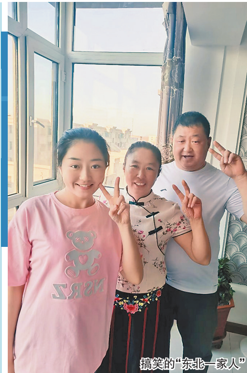
搞笑的“东北一家人”