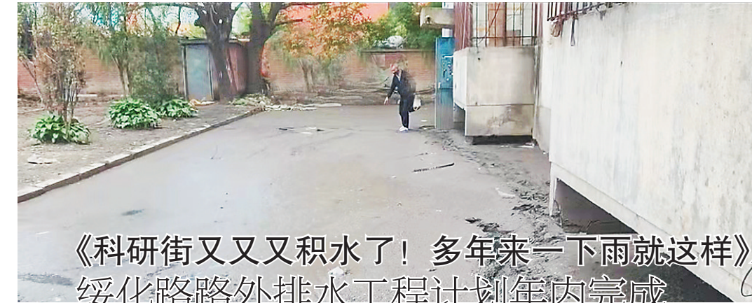
《科研街又又又积水了！多年来一下雨就这样》后续 绥化路路外排水工程计划年内完成