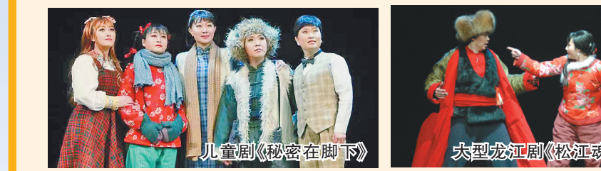
儿童剧《秘密在脚下》

生活报讯(记者 王晓晨)为了让小朋友们度过一个绚丽缤纷的“六一”儿童节,6月1日当天,我省各演出团体推出丰富多彩的线上演出。其中,黑龙江省龙江剧艺术中心推出彰显民族精神的龙江剧《松江魂》;哈尔滨儿童艺术剧院“蒲公英”小分队为大家精心准备了经典儿童剧《秘密在脚下》。