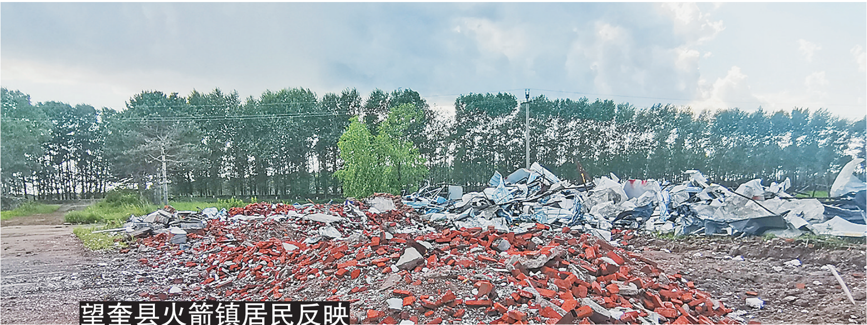
望奎县火箭镇居民反映