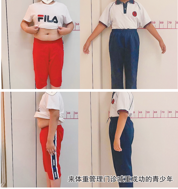
来体重管理门诊减重成功的青少年

生活报讯(记者周琳)“自2015年以来,青少年的肥胖上升速度已高于成年人。不仅仅是肥胖,很多青少年还存在太瘦的问题,目前青少年体重问题也是不可忽视的健康问题。”黑龙江省医院临床营养科主任李雨泽对生活报记者说。为此,2020年1月,黑龙江省医院将营养科从幕后“搬”到台前,正式挂牌成立临床营养科并细化了6个特色营养门诊,其中就包括体重管理门诊。近日,生活报记者在黑龙江省医院临床营养科看到很多被体重所困扰的市民。