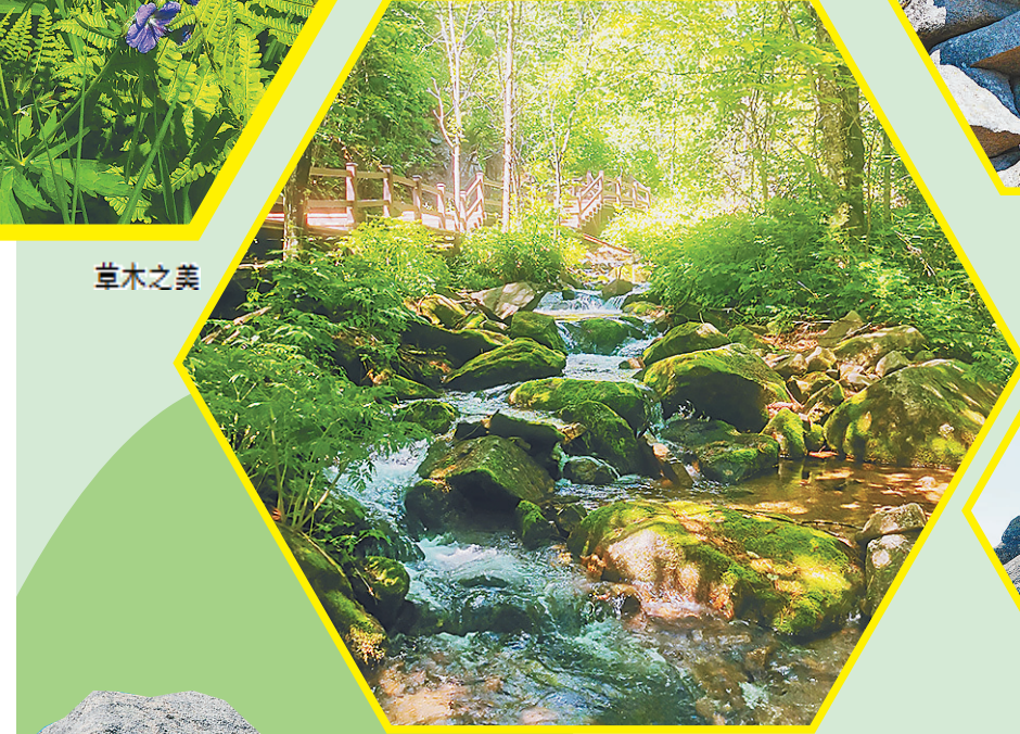
山泉溪水美如“小九寨”