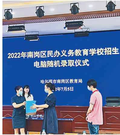
2022年南岗区民办义务教育学校招生电脑随机录取仪式

生活报讯(见习记者崔凯歌 记者吕晓艳文/摄)7月5日,2022年南岗区民办义务教育学校招生电脑随机录取仪式在哈尔滨市南岗区教育局举行。