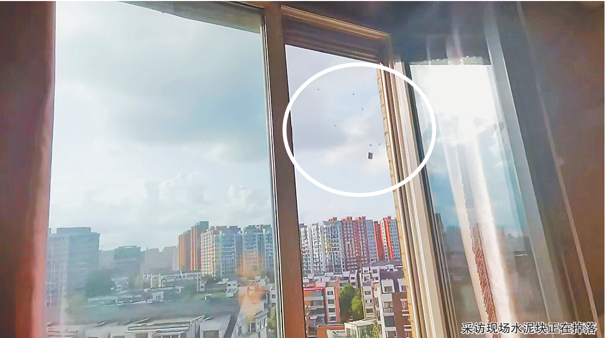
采访现场水泥块正在掉落

生活报讯（实习生孙静盈 记者秦德谦文/摄）近日，生活报记者接到哈市香坊区立汇美罗湾二期业主反映，小区院外军民街一侧窗户外水泥块频繁掉落，地下停车场漏水，消火栓锈蚀无人管。日前，记者前往现场进行了走访。