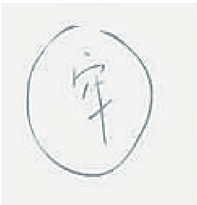
看图片猜成语,答案本版找