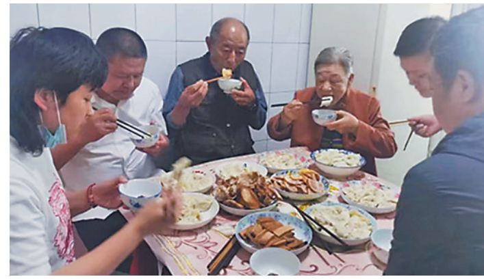
依的梦啊!” 双鸭山市福彩中心党支部将始终践行“扶老、助残、救孤、济困”的发行宗旨,坚守福彩人的责任与担当,用温暖关爱之心,积极服务社会,身体力行让福彩力量参与公益,让爱心一直传递。

生活报讯(记者李丹)近日,双鸭山市福彩中心党支部多次深入到贫困重病失独老人家里,陪老人过节、帮老人做家务,并为老人们送去生活物资,把党和政府的关心温暖送到有困难需要帮助的老人心坎里,践行民政为民,民政爱民的情怀。